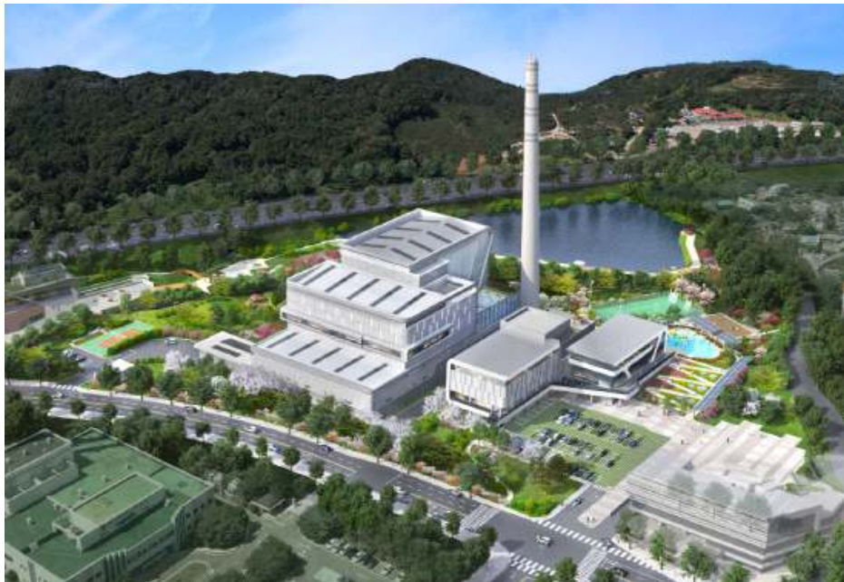
<그림 3> 김해시 자원순환시설 현대화사업 조감도

■ 특징: 단순히 쓰레기처리 기능 외에도 주민들이 이용할 수 있는 문화, 휴식공간(기존 장유 다누림센터, 탄소중립체험관 등)과 연계된 복합 환경 시설의 형태로 디자인됨(경남일보, 2025.1.2.)